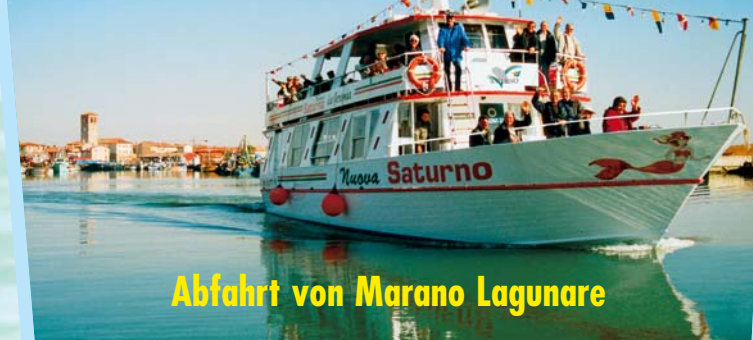
Abfahrt von Marano Lagunare

Besuch der Vogeloase von Marano Lagunare mit dem Motorschiff "Nuova Saturno"